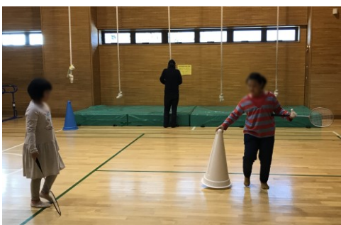
春休み勉強会の休憩時間