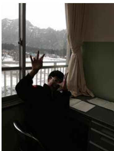
10月から3月まで週1回 (新潟駅から電車で1時間ほどの所にある学校)

新潟は外国人集住地がなく、外国から来た児童生徒が在籍する学校が散在しており、特に中山間地では支援者が少なく、支援者、児童生徒双方にとって移動が困難である場合が多いので、今年度、同上財団様による助成で、ボランティアに交通費を支払うことができ、支援が充実しました。大変ありがたかったです。