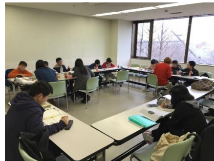
春休み勉強会の様子(2017 年 3 月末)