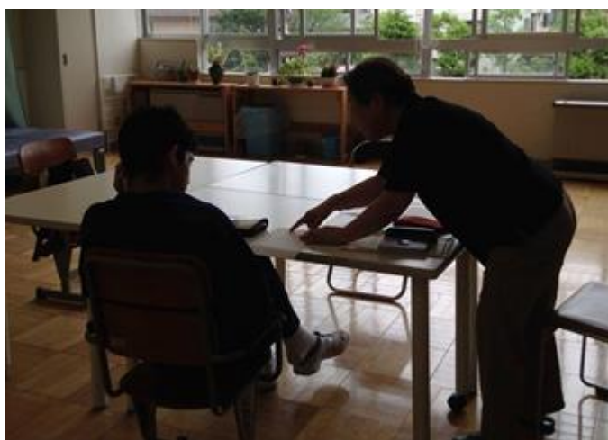
5月から2月まで週2回程度 (新潟市内の学校)