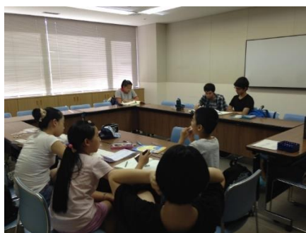
夏休み勉強会の様子(2016 年 8 月中旬)