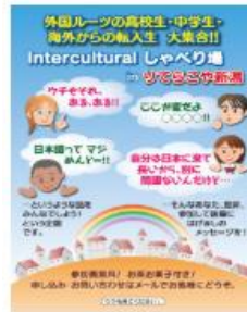
Intercultural しゃべり場と勉強会のチラシと当日の様子

新潟県勤労者福祉厚生財団様より助成をいただき、外国につながる子どもの交流スペースとして、年6回「Intercultural しゃべり場」を開催しました。また、夏休みと春休みには、学習会を開催し、ボランティアの先生と一緒に勉強したり、おしゃべりしたりして交流する機会を作りました。さらに、インターネットで交流できるよう、Intercultural Students' Forum 外国につながる生徒の広場を作成しました。サイトは こちら をクリックするとご覧になれます。(サイトの改訂に伴い、2018年10月に閉鎖しました。)