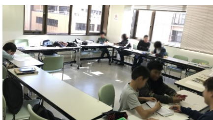
春休み勉強会の様子