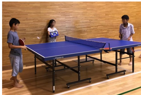
夏休み勉強会の休憩時間