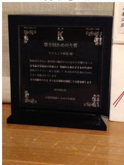
かめのり賞 記念の盾