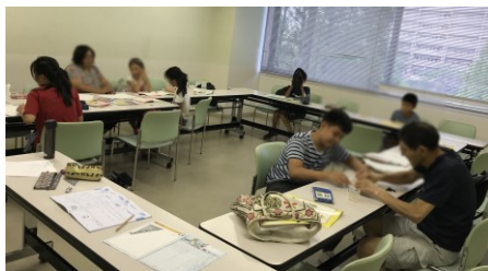
夏休み勉強会の様子