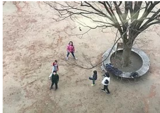
夏休み勉強会の様子と冬休み勉強会の休憩時間の様子