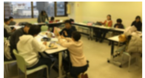
冬休み勉強会の様子