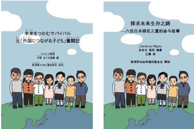
日本語版と中国語版の表紙の写真